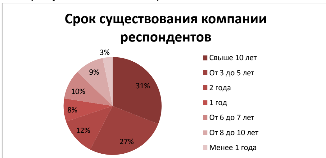
Рисунок 4. Срок существования компании респондентов