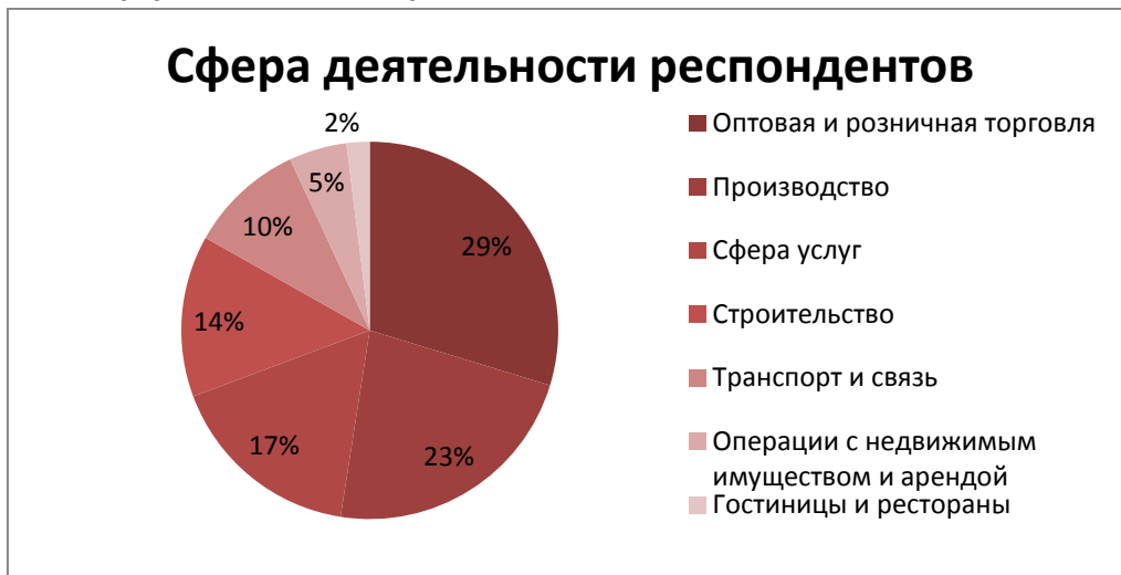
Рисунок 3. Сфера деятельности респондентов