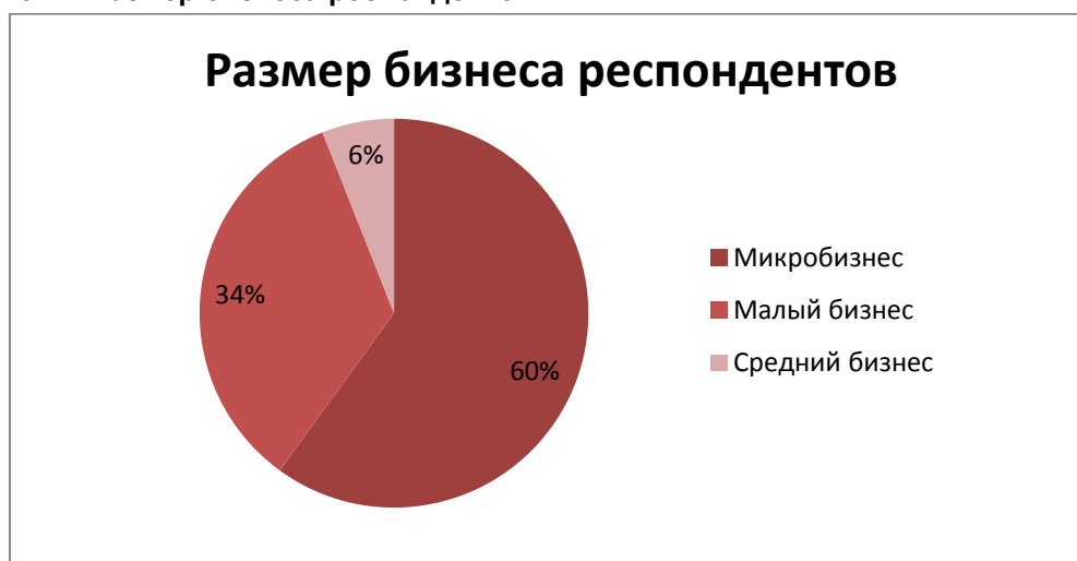
Рисунок 2. Размер бизнеса респондентов